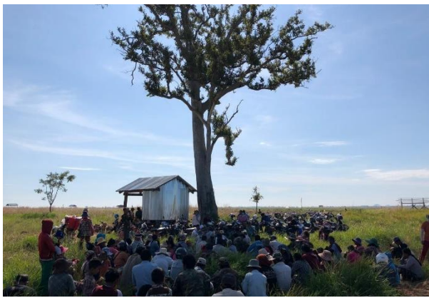
គុណភាពថ្មីនៃការសម្របសម្រួលសមូហភាពដំបូងបង្អស់នៅក្នុងតំបន់អាស៊ីអាគ្នេយ៍ ដោយស្របតាមការណែនាំរបស់សាលាឧទ្ធរណ៍ថៃ ដើម្បីឱ្យមានការរួមចំណែករបស់សហគមន៍ក្នុងការសម្របសម្រួលសមូហភាពដំបូងបង្អស់។

សាលាឧទ្ធរណ៍ថៃក្រសួងយុត្តិធម៌សម្រាប់បណ្តឹងឆ្លងដែនសមូហភាពដំបូងបង្អស់ នៅតំបន់អាស៊ី អាគ្នេយ៍ចំពោះការរំលោភបំពានសិទ្ធិមនុស្ស